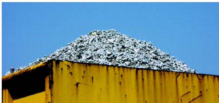
Wertvolle Rohstoffe, sinnvoll zurückgewonnen durch Recycling!

Das airTOX Gas-Photometer ist ein klassisches Ein-Küvetten-Infrarotspektrometer: Die über einen Strahler erzeugte breitbandige Infrarotstrahlung wird über ein zeitgesteuertes Blendenrad durch eine mit Messgas gefüllte Küvette geführt. Die Messkomponenten absorbieren dabei in substanzspezifischer Weise bestimmte Anteile (Wellenlängenbereich) der Strahlung. Das Ausmaß dieser Absorption ist ein Maß für die Konzentration der jeweiligen Komponente. Die am Ende der Küvette verbleibende Intensität wird nach Durchgang durch einen schmalbandigen Filter mit einem Detektor gemessen. Bei der gleichzeitigen Messung von mehreren Komponenten kommt eine entsprechend grosse Anzahl von Filter/Detektorkombinationen zum Einsatz.