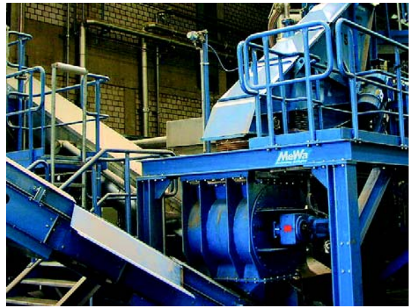
Die Abbildungen zeigen Details eine der modernsten Kühlgeräte-Recyclinganlagen in Deutschland!

Durch die modulare Bauweise kann das Photometer zusätzlich mit einem elektrochemischen Sensor für O 2 ausgestattet werden. Zusätzlich haben wir für die Überwachung von Kühlgeräte-Recyclinganlagen auch ein paramagnetisches O 2 Messsystem sowie ein Pentan -Messsystem (IR) in unserem Produktportfolio.